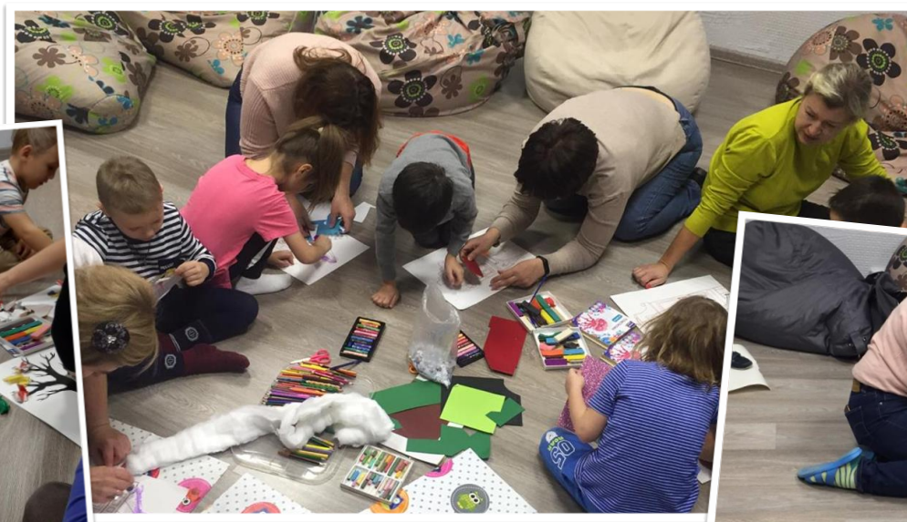
Задания на развитие ЭМОЦИОНАЛЬНОГО ИНТЕЛЛЕКТА