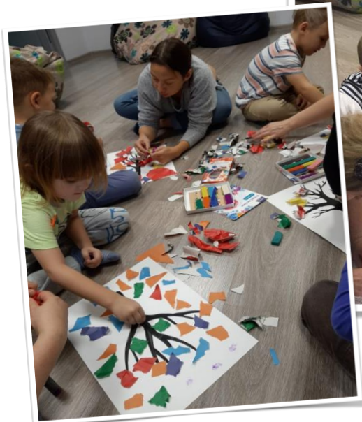
Совместные игры и творчество