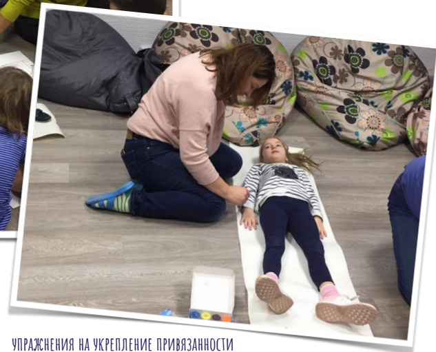
Упражнения на укрепление привязанности в паре родитель-ребенок